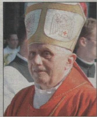
Papa Benedetto XVI

Adiconsum ha deciso, quindi, di attivare sul proprio sito www.adiconsum.it il servizio SOS SCUOLA per monitorare tutte le situazioni in essere. Adiconsum invita, pertanto, tutte le famiglie che stanno avendo problemi in tal senso a segnalarlo.