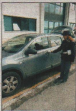
Una delle auto sequestrate

Spaccio a San Pietro "Intoccabili" tutti ai domiciliari