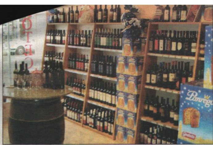
Prodotti pugliesi in vetrina in Germania

Incontro in Regione con istituzioni e imprese tedesche