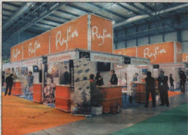
Puglia protagonista ieri della 28ª edizione della Borsa internazionale del turismo in corso alla Fiera di Milano. In primo piano l'offerta turistica del Grande Salento con le proposte delle province di Brindisi, Lecce e Taranto Alle pagg. 2 e 3

Alla Bit, il piano di rilancio di Ostillo Il Grande Salento fa sistema e vince la sfida del turismo