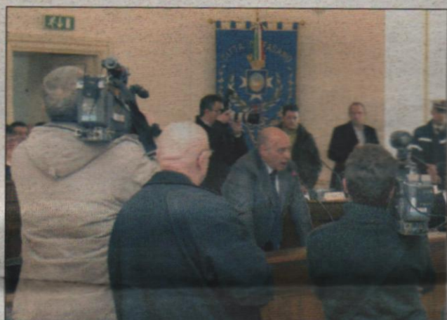
La beffa del casinò continua a tener banco. A Fasano, in Consiglio, la maggioranza fa quadrato intorno al sindaco Di Bari, che in un'intervista parla di altre offerte ricevute e declinate. A Francavilla proiettato in piazza il video Alle pagg. 14 e 15

Beffa del casinò. A Francavilla la proiezione Fasano, la maggioranza si stringe intorno a Di Bari